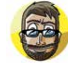
Kili Grafikdesigner Comics, Gemälde & Digital Art