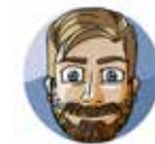
Thomas Astrophysiker Gesang & Komplexes