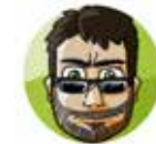
Manu Softwareentwickler Technik & Fotografie